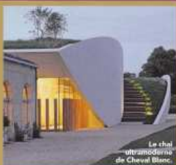
Le chai ultramodern de Cheval Blanc.

Les plus grands spécialistes dressent le portrait du vignoble de demain