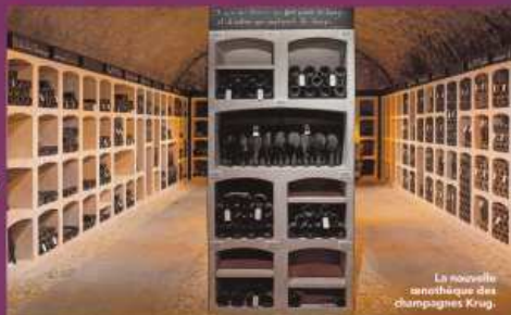
La nouvelle enothèque des champagnes Krug.